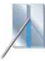
PF Poloha svislá nahoru