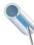
PE Poloha vodorovná nad hlavou