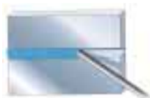
PC Poloha vodorovná