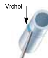
J-LO60 Svařování od vrcholu svaru dolů (60°)