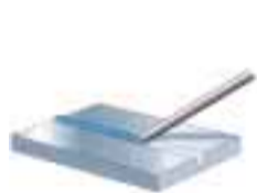
PA Poloha vodorovná shora