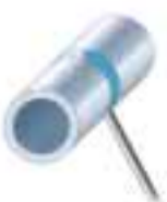
PG Poloha svislá dolů