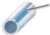
PB Poloha vodorovná šikmo shora